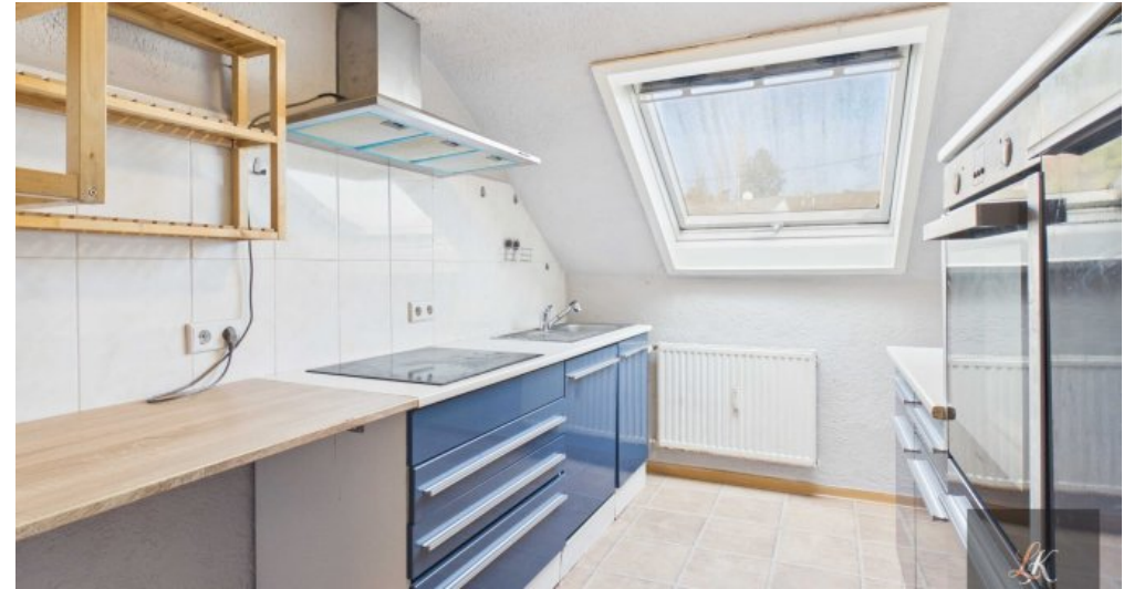
Wohn- und Geschäftshaus mit Restaurant und 3 Wohneinheiten in Völklingen-Geislautern