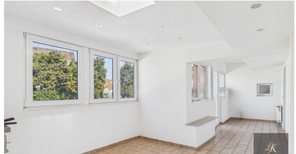
Wohn- und Geschäftshaus mit Restaurant und 3 Wohneinheiten in Völklingen-Geislautern