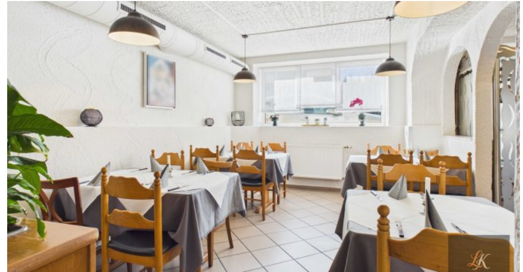
Wohn- und Geschäftshaus mit Restaurant und 3 Wohneinheiten in Völklingen-Geislautern