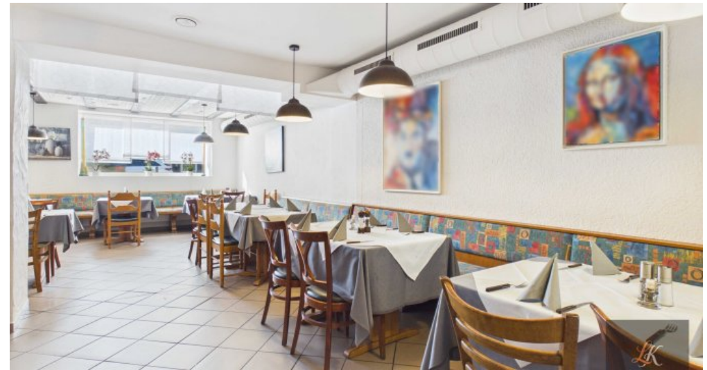
Wohn- und Geschäftshaus mit Restaurant und 3 Wohneinheiten in Völklingen-Geislautern