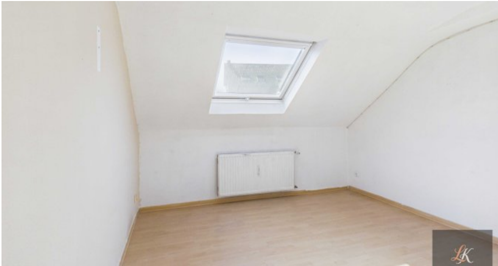
Wohn- und Geschäftshaus mit Restaurant und 3 Wohneinheiten in Völklingen-Geislautern