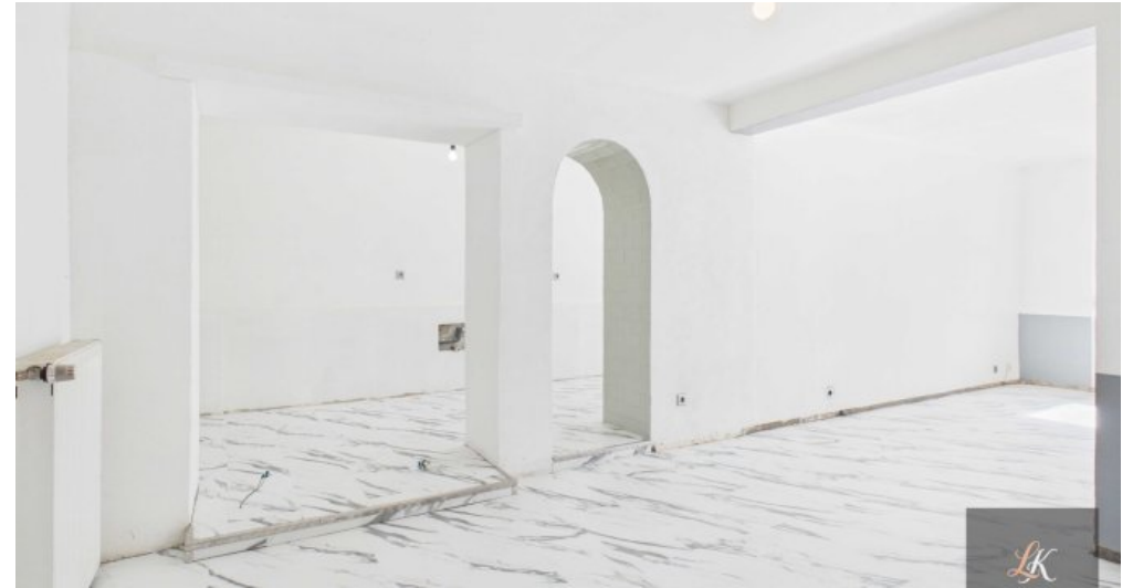
Wohn- und Geschäftshaus mit Restaurant und 3 Wohneinheiten in Völklingen-Geislautern