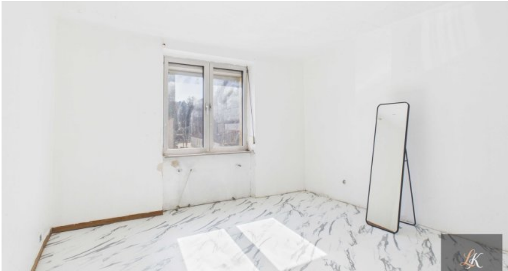
Wohn- und Geschäftshaus mit Restaurant und 3 Wohneinheiten in Völklingen-Geislauren