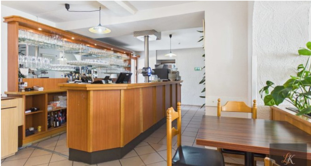
Wohn- und Geschäftshaus mit Restaurant und 3 Wohneinheiten in Völklingen-Geislautern