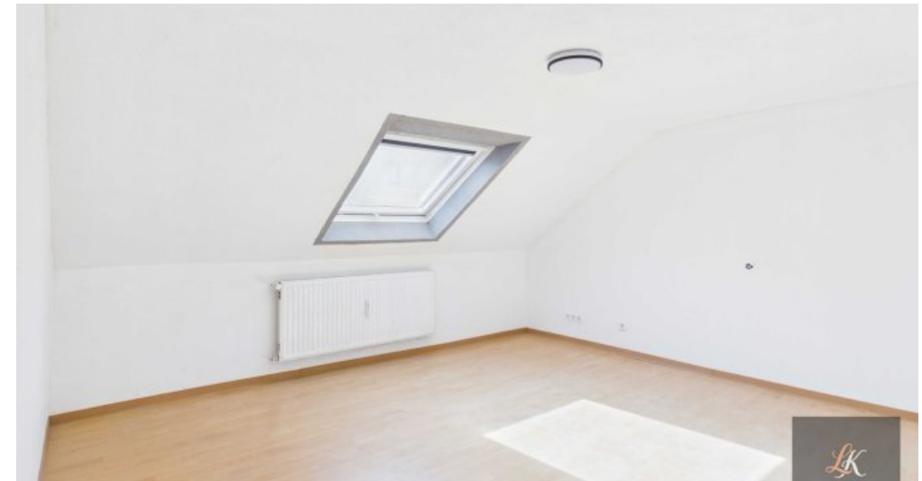
Wohn- und Geschäftshaus mit Restaurant und 3 Wohneinheiten in Völklingen-Geislautern