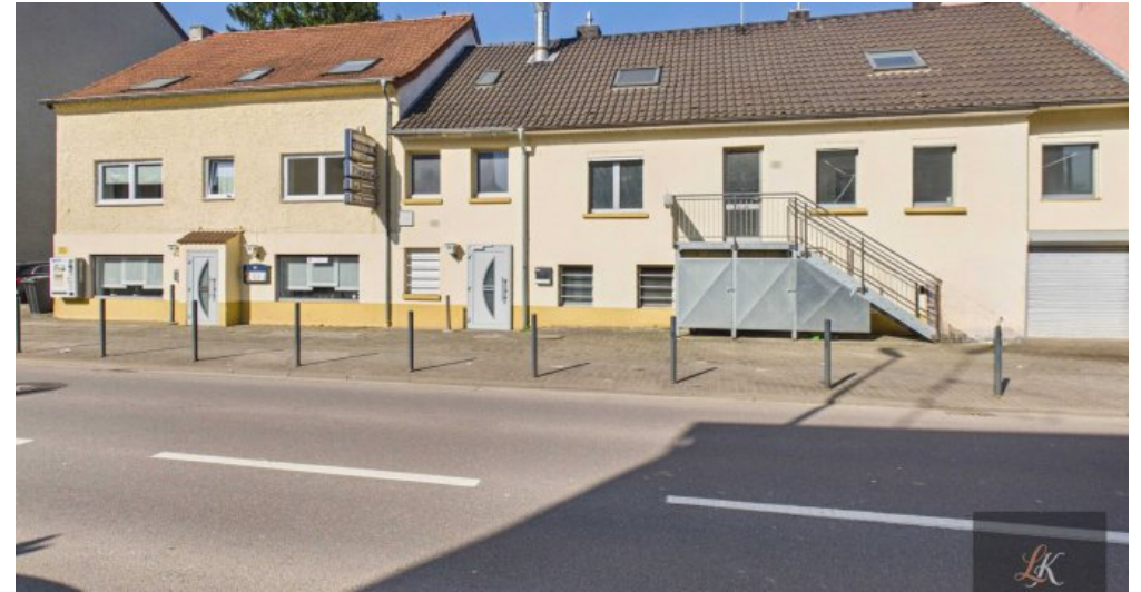
Wohn- und Geschäftshaus mit Restaurant und 3 Wohneinheiten in Völklingen-Geislautern