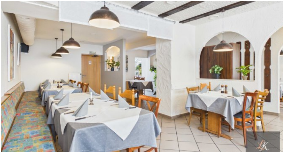
Wohn- und Geschäftshaus mit Restaurant und 3 Wohneinheiten in Völklingen-Geislautern