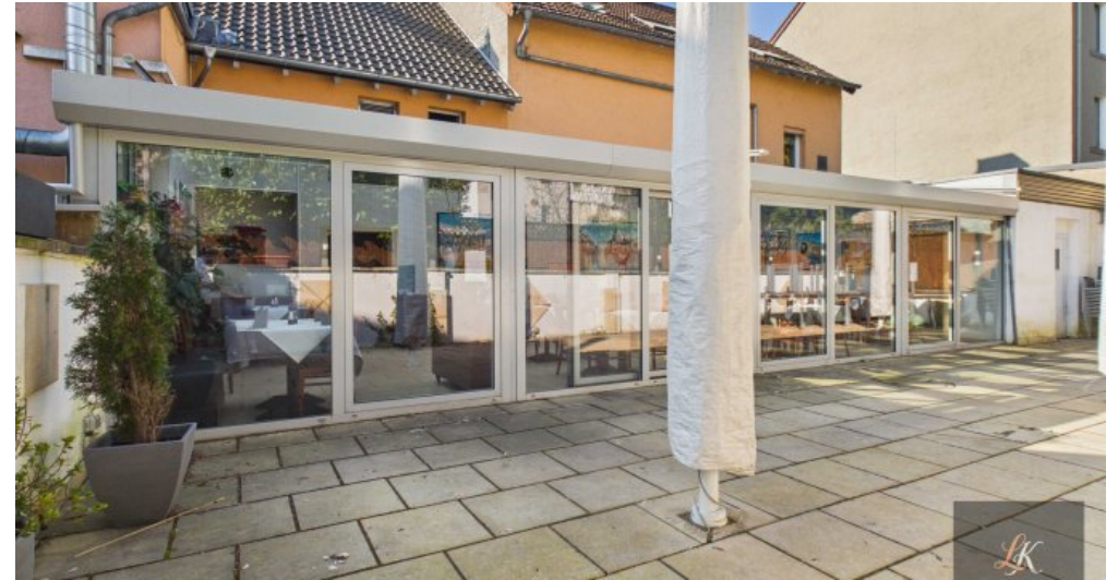
Wohn- und Geschäftshaus mit Restaurant und 3 Wohneinheiten in Völklingen-Geislautern