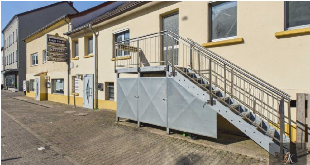
Wohn- und Geschäftshaus mit Restaurant und 3 Wohneinheiten in Völklingen-Geislautern