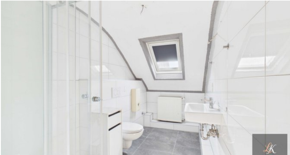
Wohn- und Geschäftshaus mit Restaurant und 3 Wohneinheiten in Völklingen-Geislauren