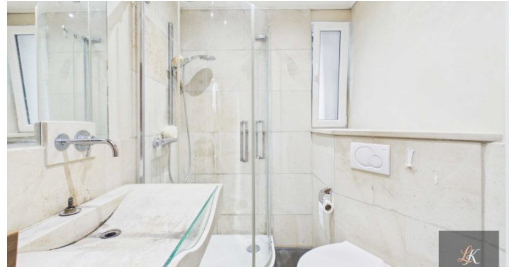
Wohn- und Geschäftshaus mit Restaurant und 3 Wohneinheiten in Völklingen-Geislauren