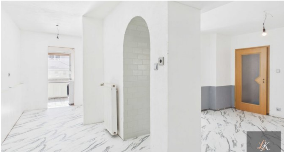
Wohn- und Geschäftshaus mit Restaurant und 3 Wohneinheiten in Völklingen-Geislautern