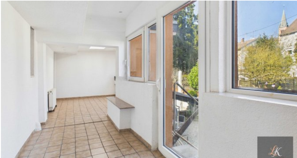
Wohn- und Geschäftshaus mit Restaurant und 3 Wohneinheiten in Völklingen-Geislautern