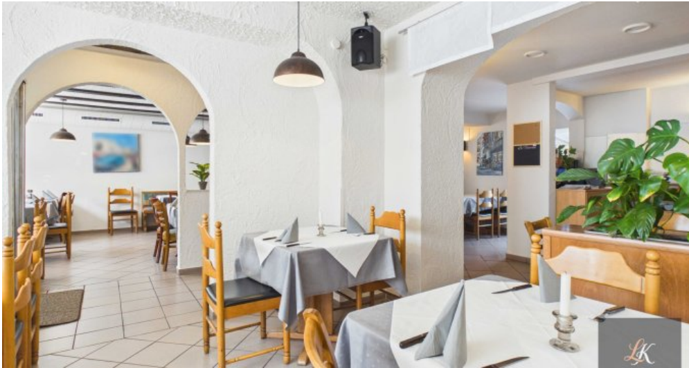
Wohn- und Geschäftshaus mit Restaurant und 3 Wohneinheiten in Völklingen-Geislautern