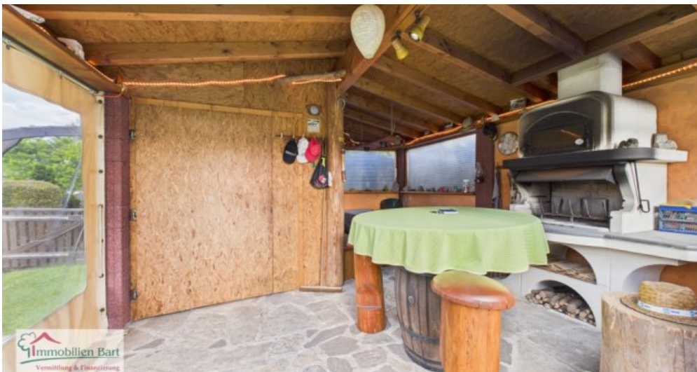
Gartenhaus mit Pizzaofen