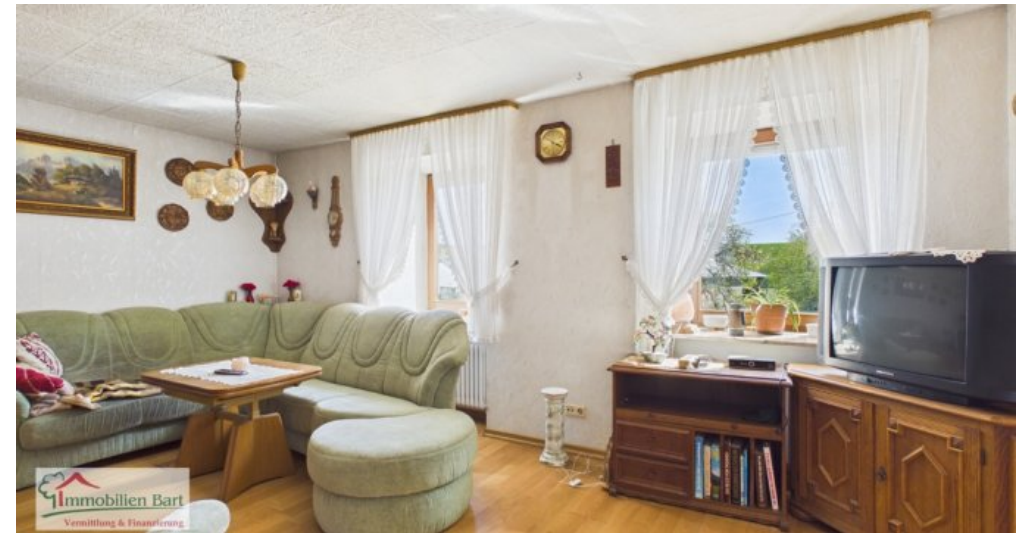
OG - Wohnzimmer