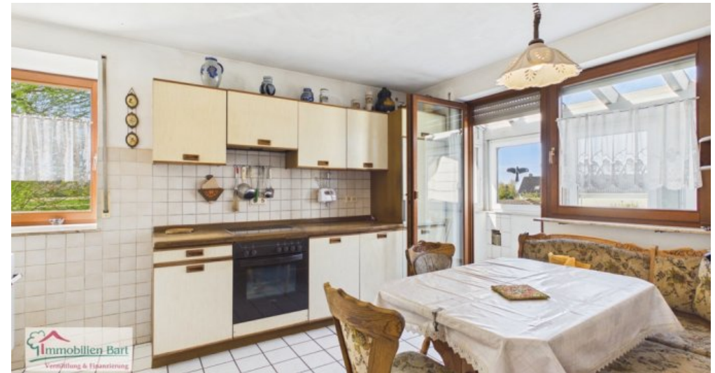
OG - Küche mit Zugang zum Wintergarten