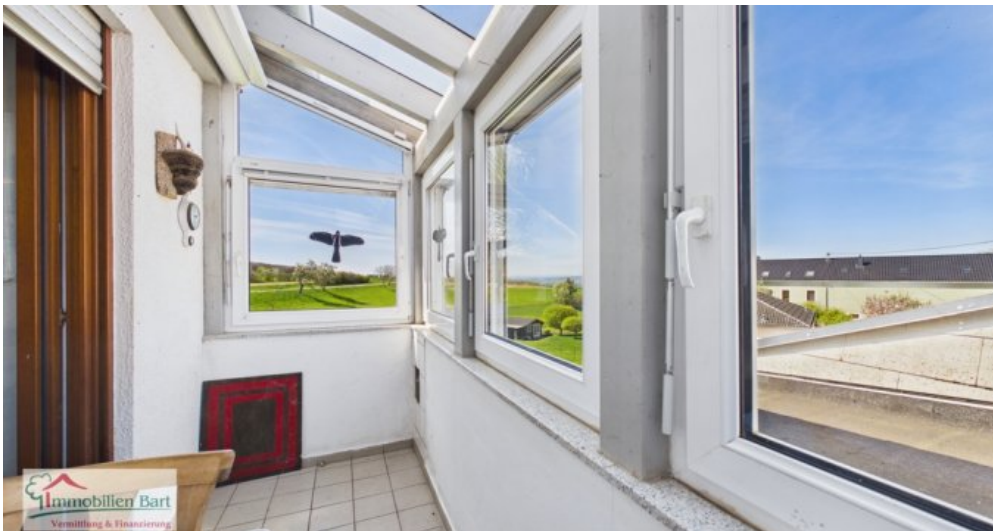
OG - Wintergarten