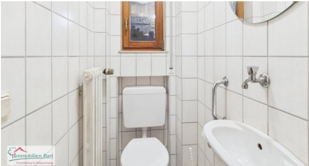
EG - Gäste-WC