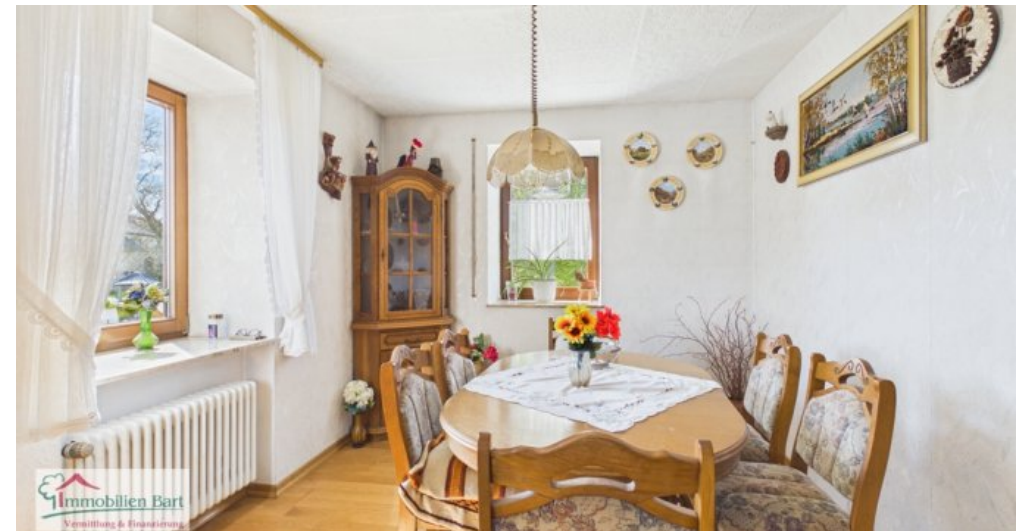
OG - Esszimmer