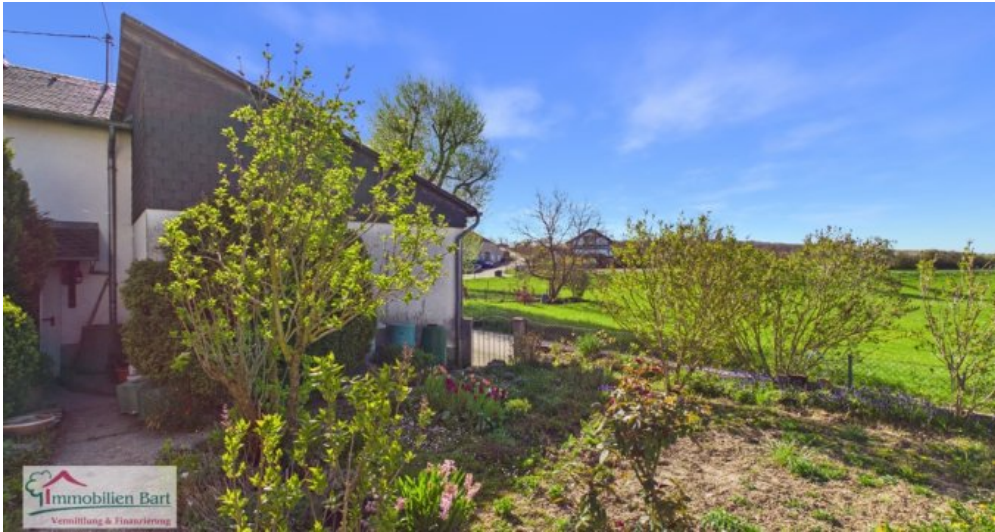
Garten und Aussicht