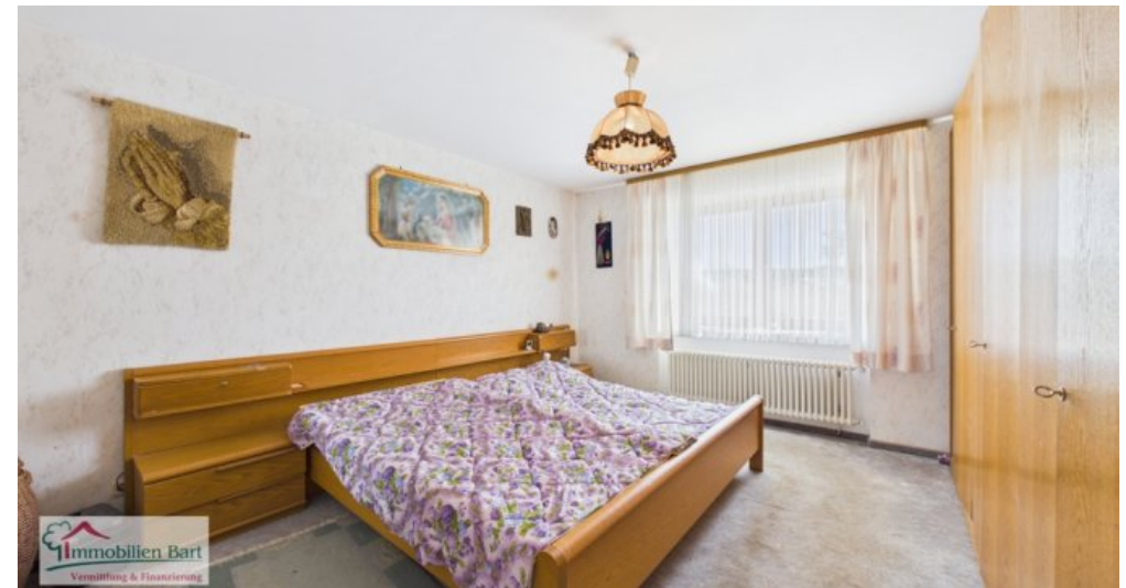
OG - weiteres Schlafzimmer