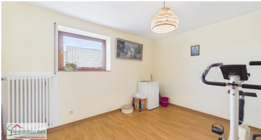
OG - Schlafzimmer