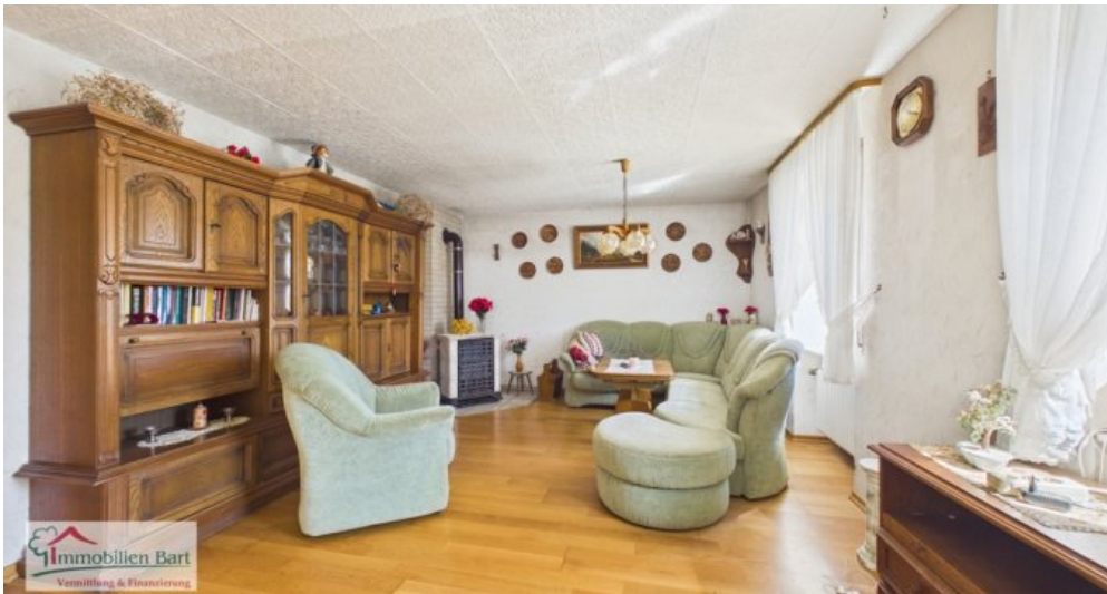
OG - Wohnbereich