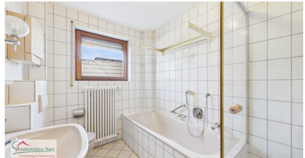
OG - Tageslichtbad mit Wanne und Dusche