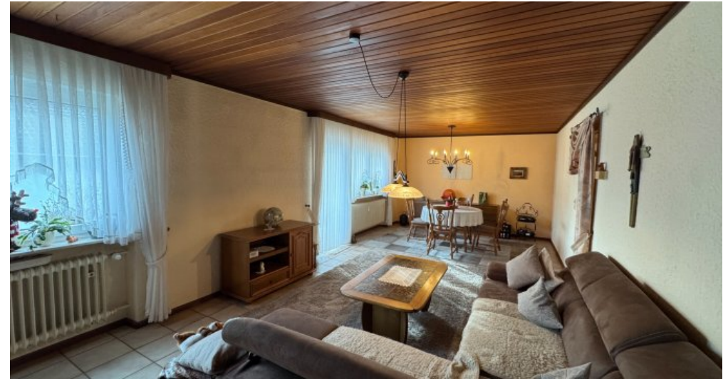
Wohn- Esszimmer EG