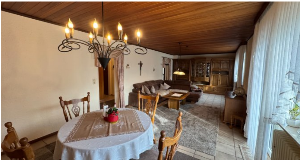
Wohn- Esszimmer EG