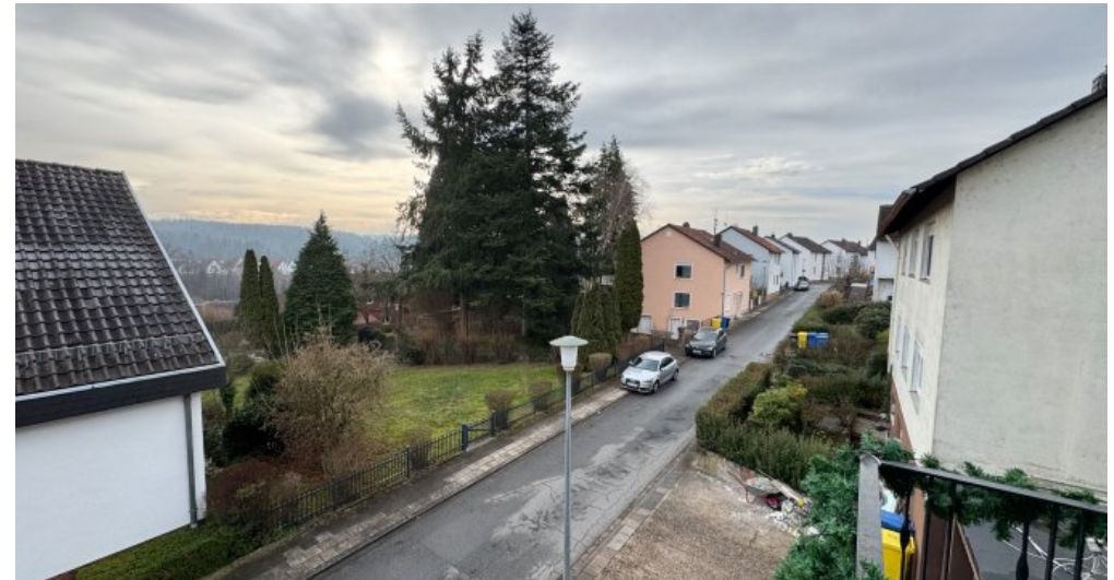
Ausblick Balkon OG