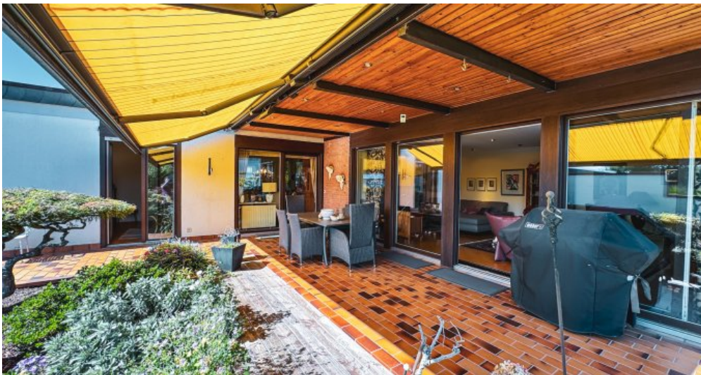
Terrasse mit Markise