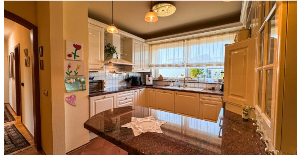
Küche mit hochwertiger Einbauküche EG