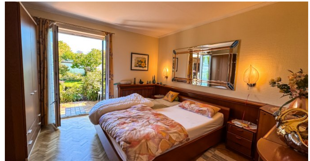
Schlafzimmer mit Ausgang Terrasse EG