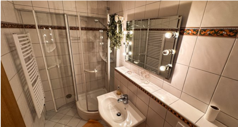
Badezimmer mit Dusche UG