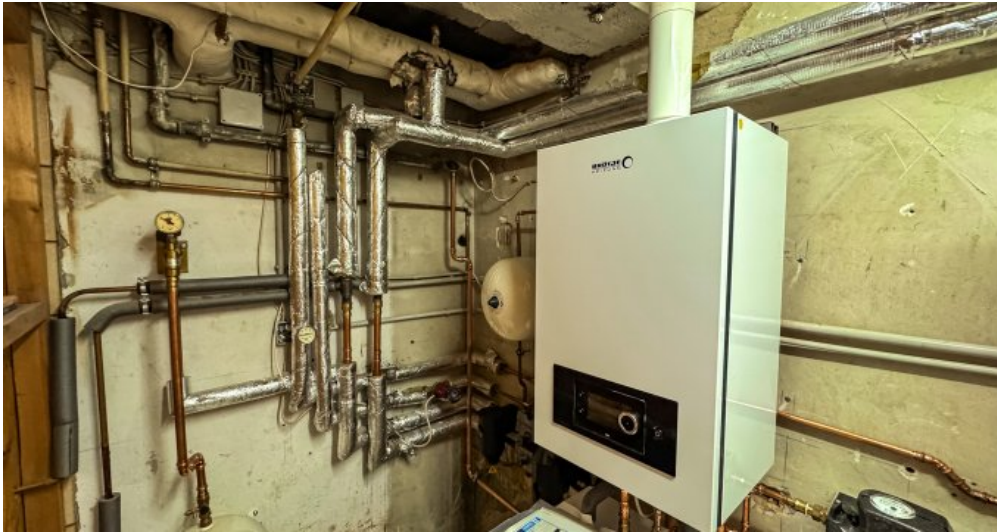
Gas- Brennwertheizung Bj. 2025 Brötje