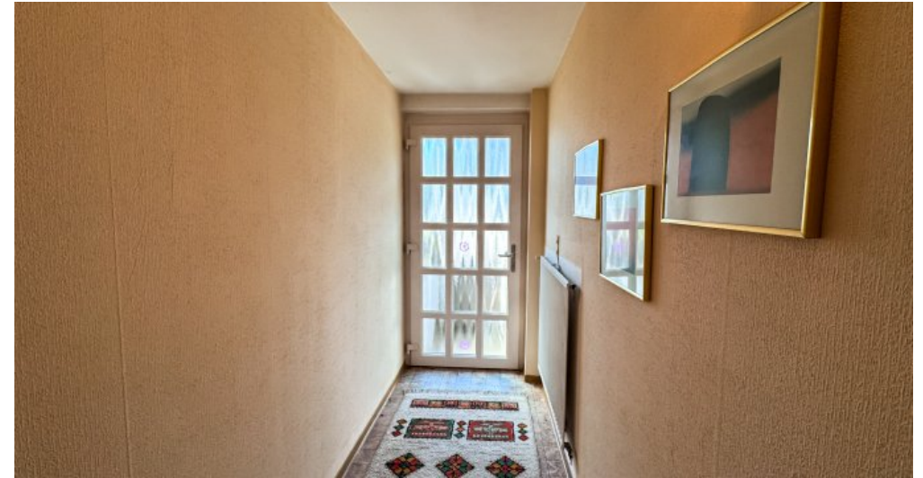
Flur/Eingangsbereich ELW im UG