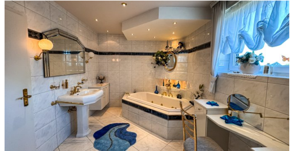
Badezimmer mit Wanne/Dusche EG