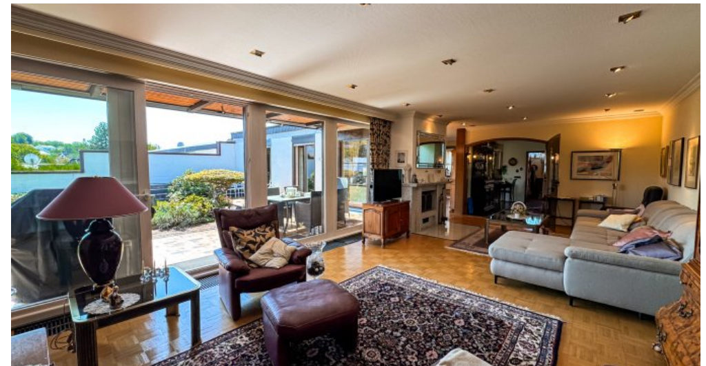
Wohnzimmer mit Terrassenausgang EG