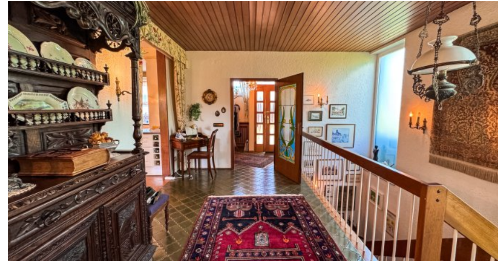
Flur mit Treppenhaus ins UG