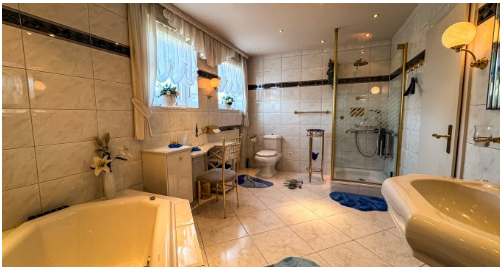
Badezimmer mit Wanne/Dusche EG