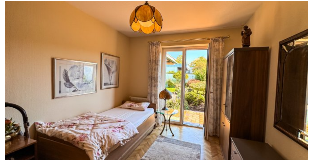
Schlafzimmer mit Ausgang Terrasse EG