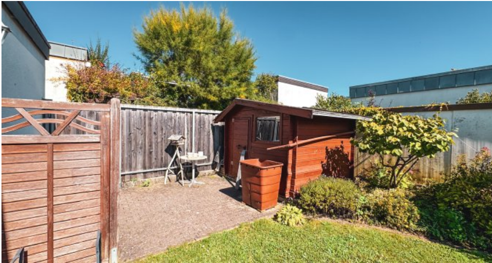
Gartenhaus und seitlicher Eingang Garten