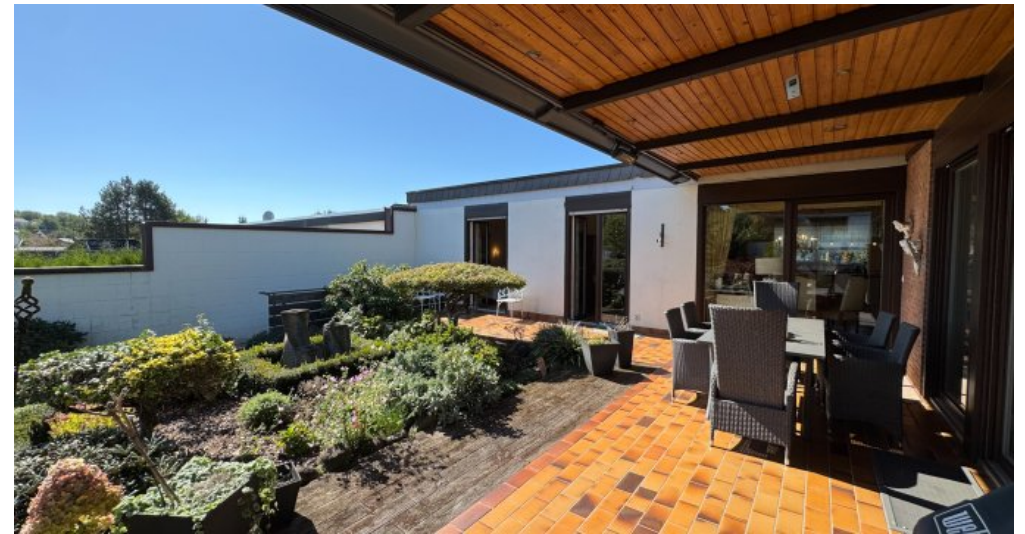
Terrasse mit Garten EG