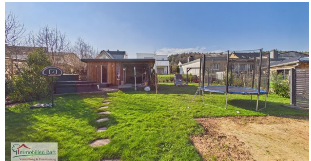
Garten mit Gartenhaus