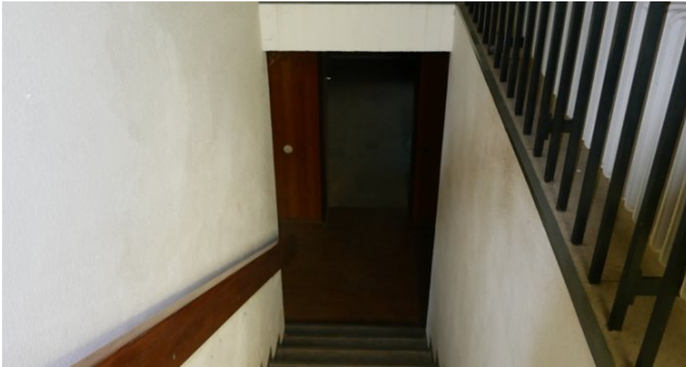
Treppe zum Keller