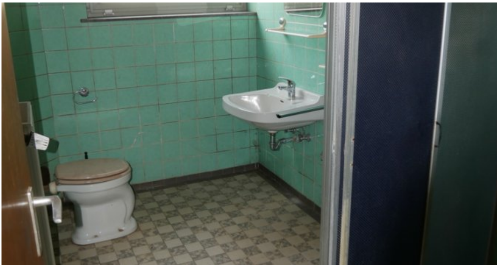
Bad im Keller