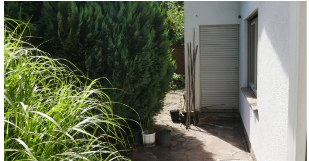
Seitliche Zugang vom Wintergarten zur Terrasse