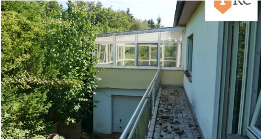
Balkon mit Blick auf den Wintergarten