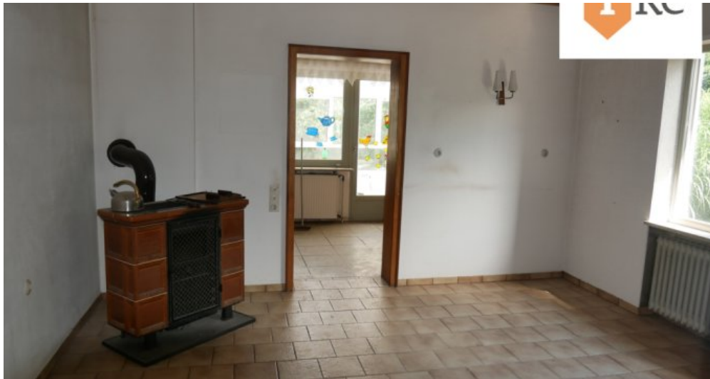
Zimmer mit Kaminofen