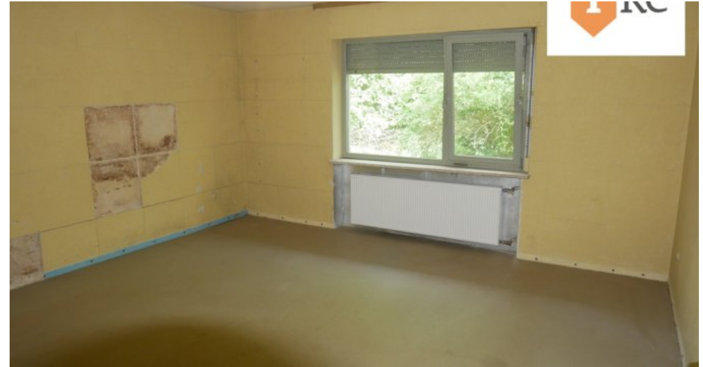
Zimmer im Keller