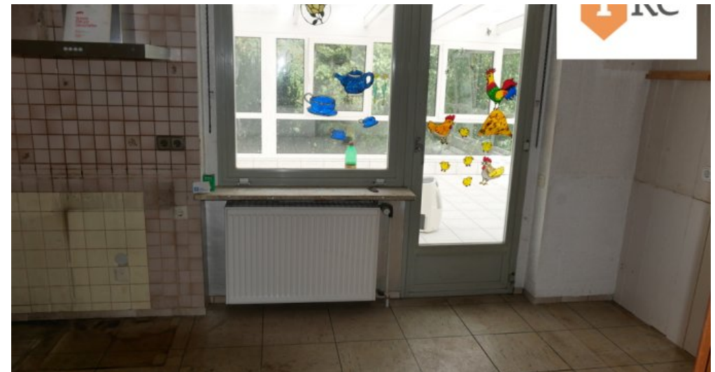
Küche mit Zugang zum Wintergarten