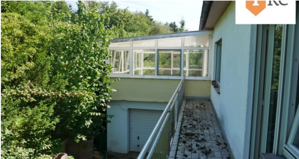
Balkon mit Blick auf den Wintergarten