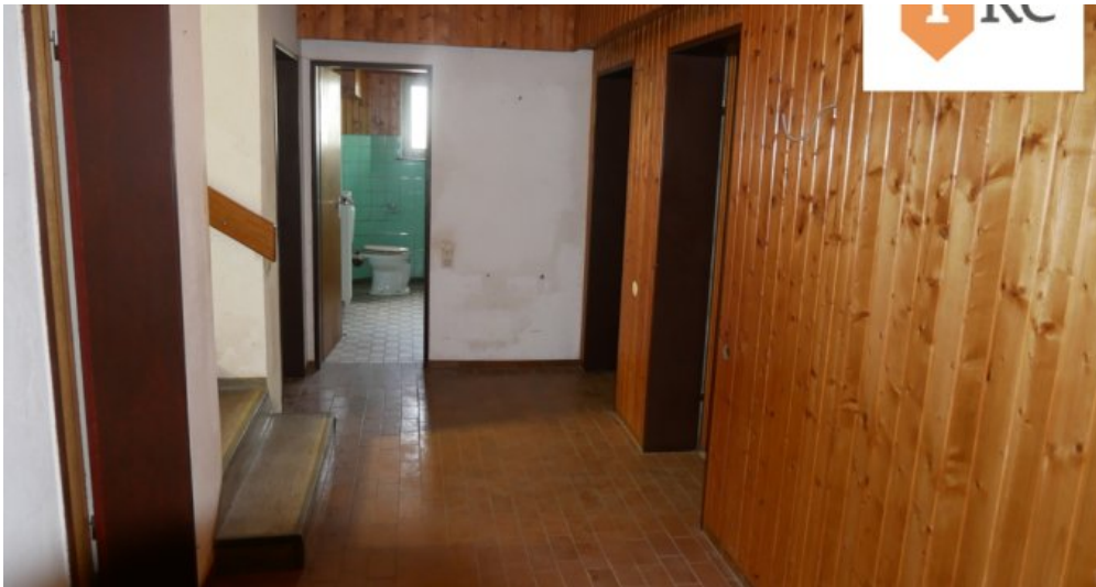
Flur im Keller