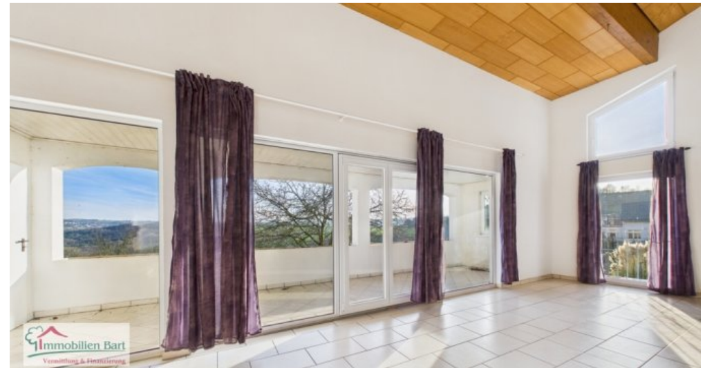
EG - Wohnzimmer mit Zugang zum großen Balkon