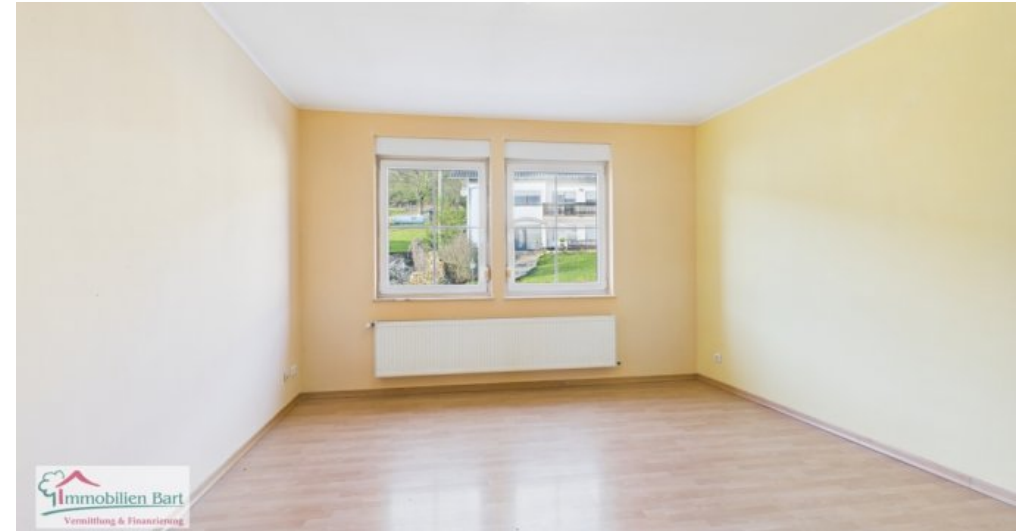
OG - zweites Schlafzimmer