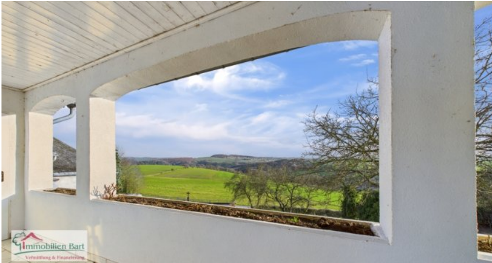
EG - Balkon Ausblick