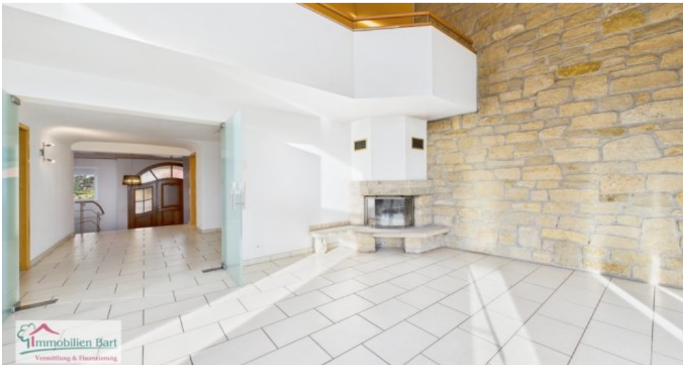
EG - Wohn-Esszimmer