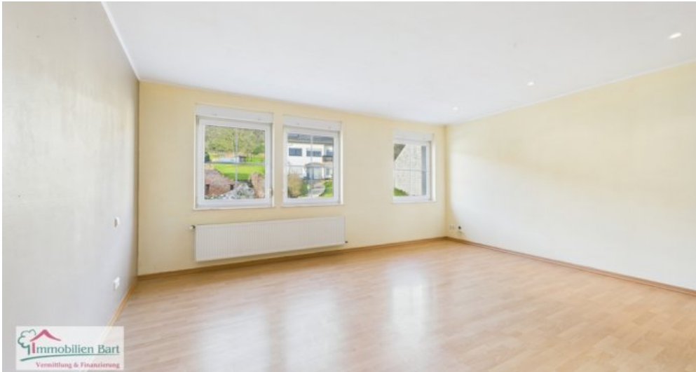
OG - erstes Schlafzimmer