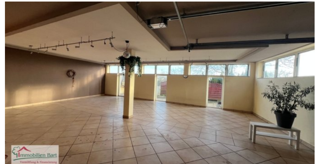
KG - Partykeller