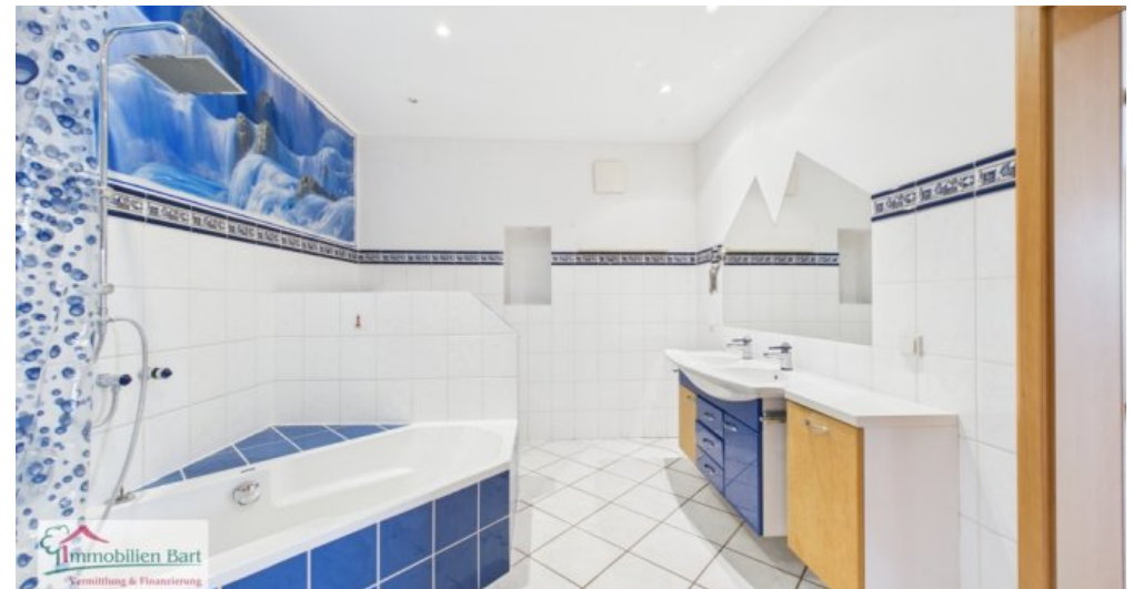
OG - Badezimmer