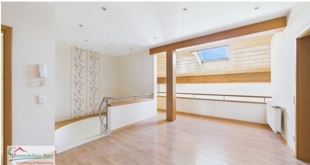
OG - Diele