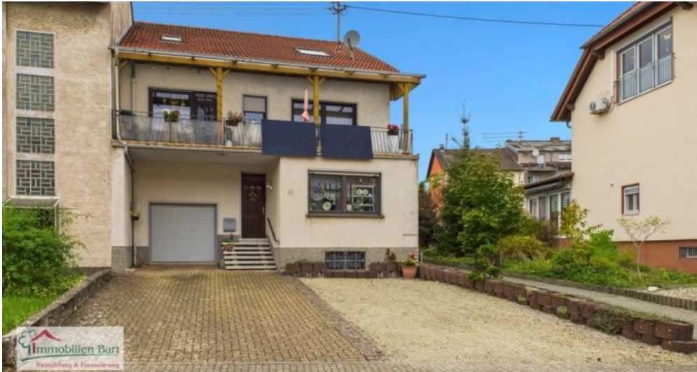
Kopie von Hier scannen! (1)