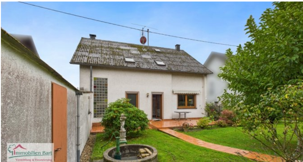
Rückansicht mit Terrasse