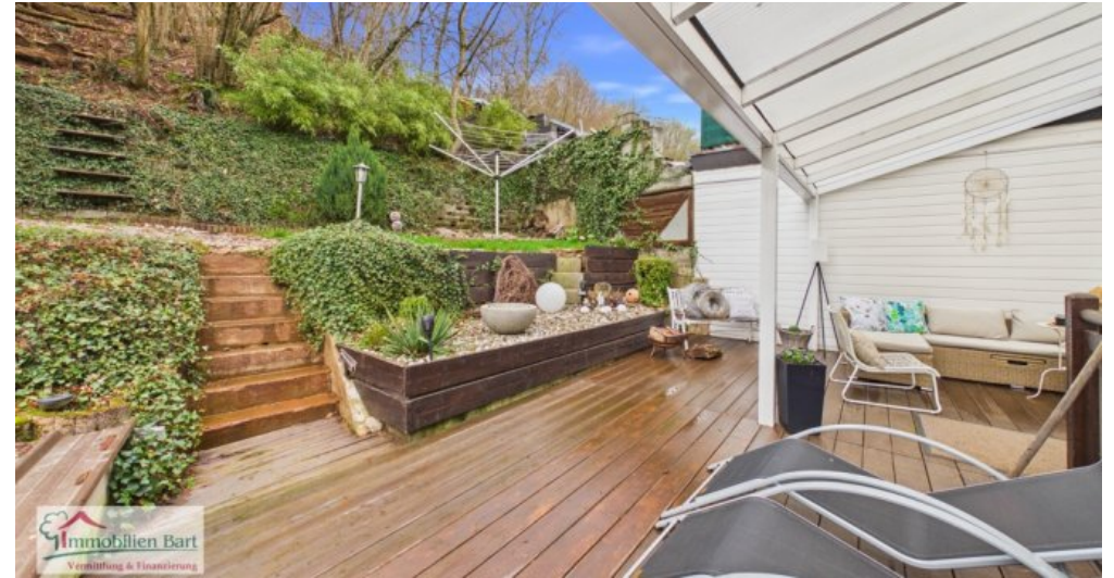
Terrasse mit Zugang zum eigenen Waldteil