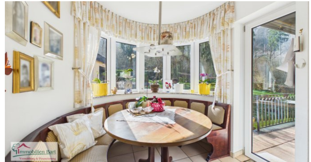
Sitzbank mit Zugang zur Terrasse