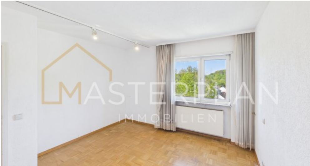
Schlafzimmer kleine WHG