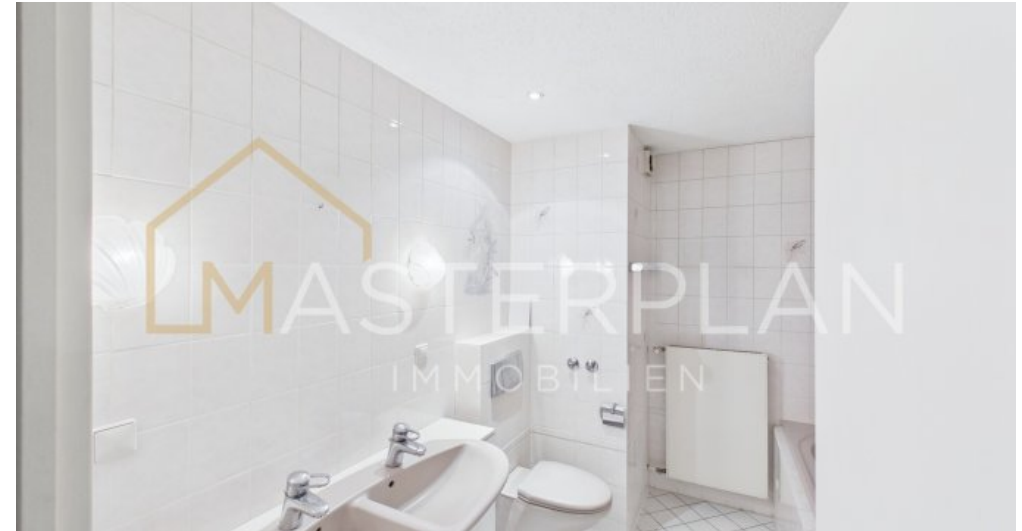
bad kleine WHG