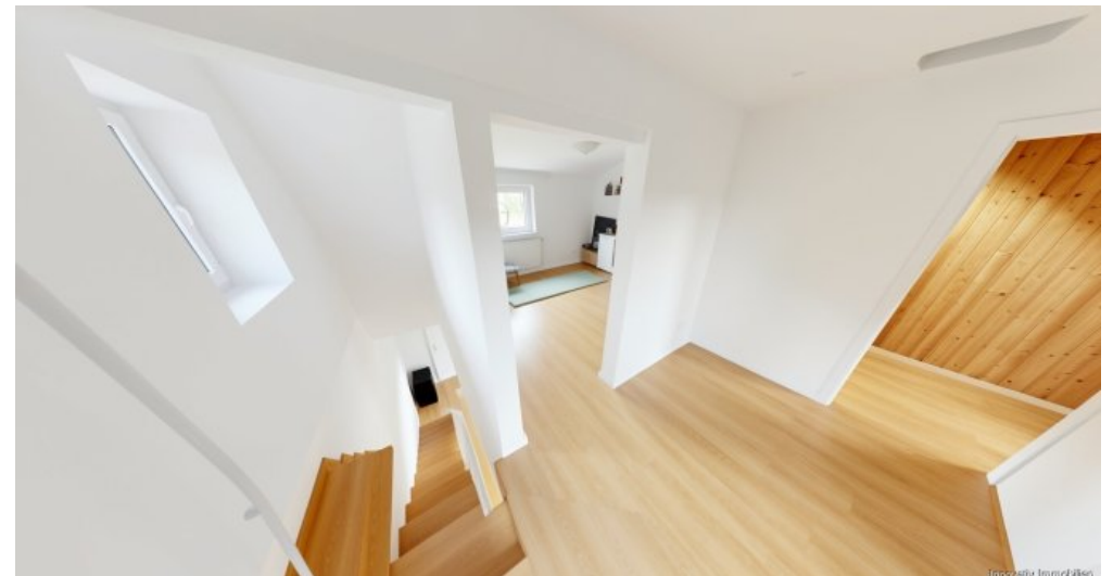
Flur DG visualisiert