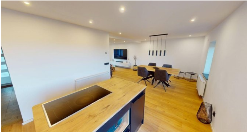
Wohn Esszimmer EG