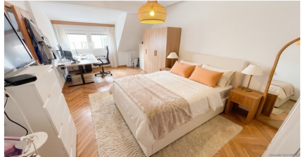
Eltern DG visualisiert