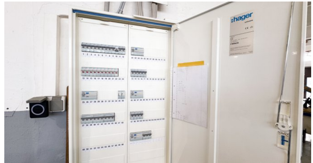
Unterverteilung Strom Halle