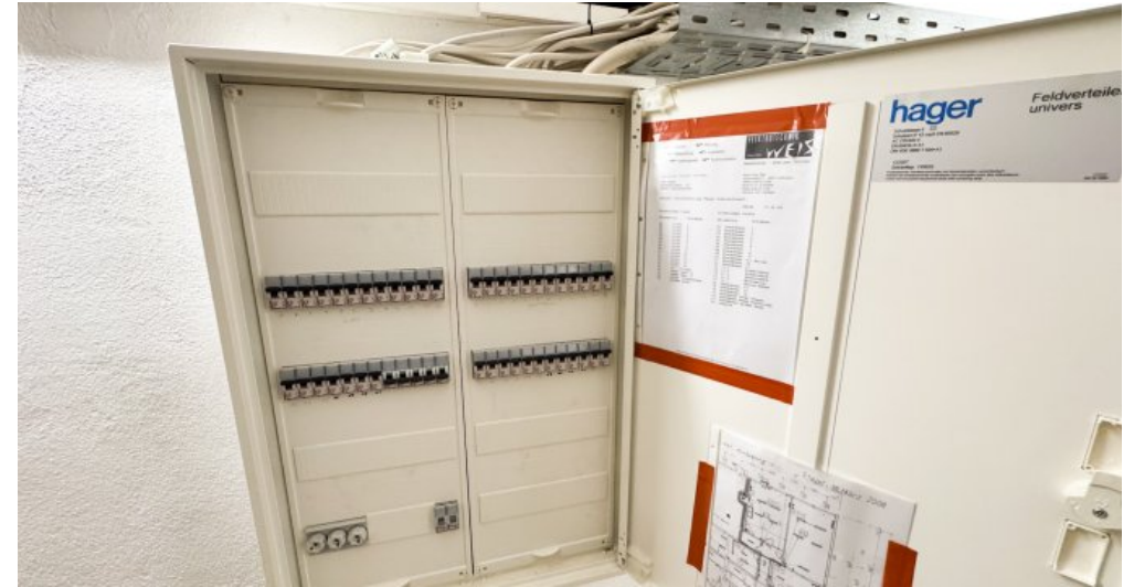
Unterverteilung Strom Büro