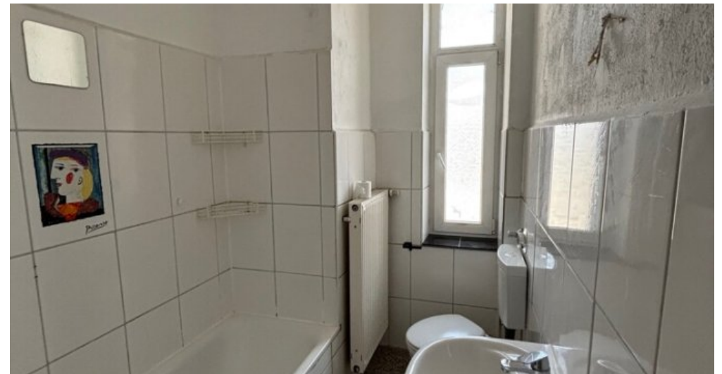
Bad mit Wanne und Fenster