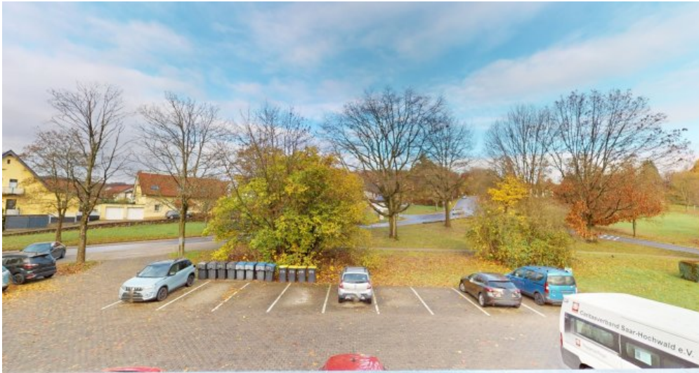
Umgebung von Balkon aus