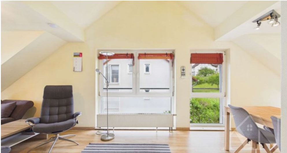
Wohn- / Essbereich