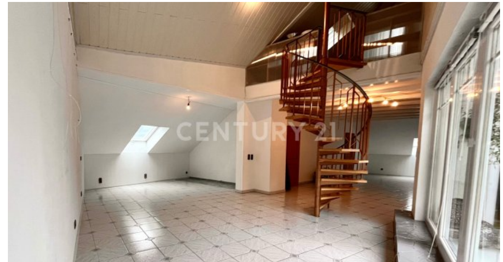
Wohn- und Esszimmer