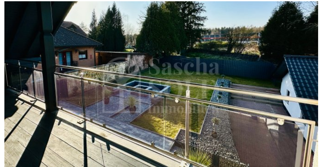
WE im DG - Loggia