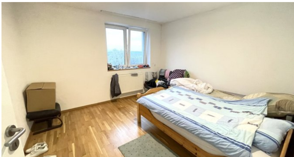
Schlafzimmer OG links.