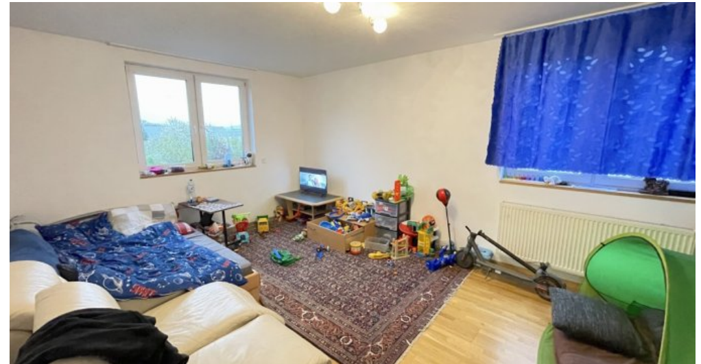
Wohnzimmer OG links