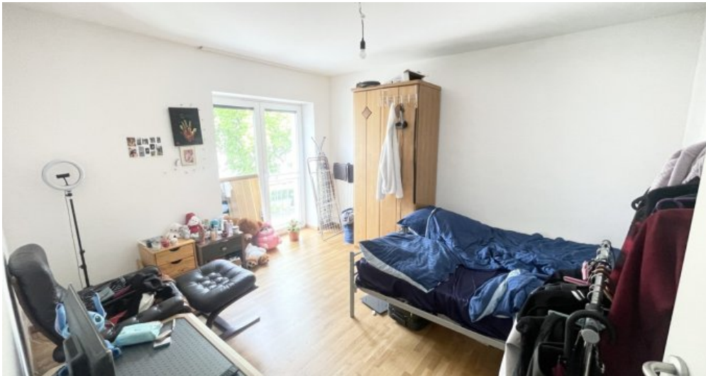
Schlafzimmer OG links