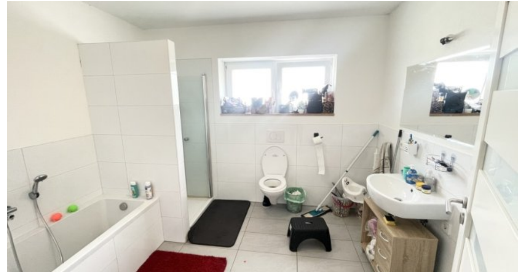
Bad OG links