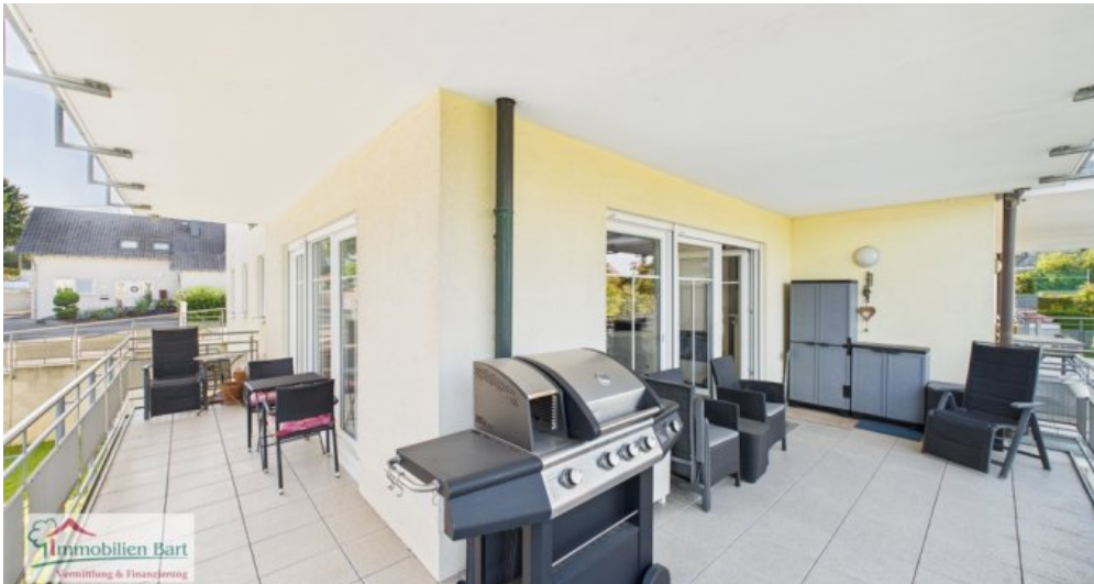
großer Balkon nach Südwesten