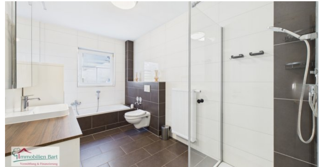
Badezimmer / Vollbad