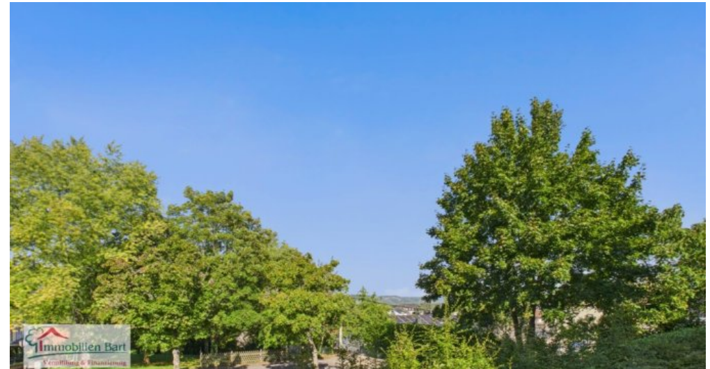
Fernsicht nach Luxemburg