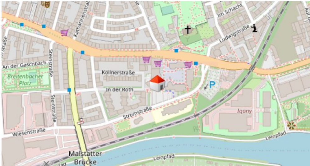
Lageplan Malstatter Markt 4