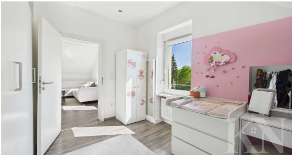
Kinderzimmer Übergang Wohnzimmer