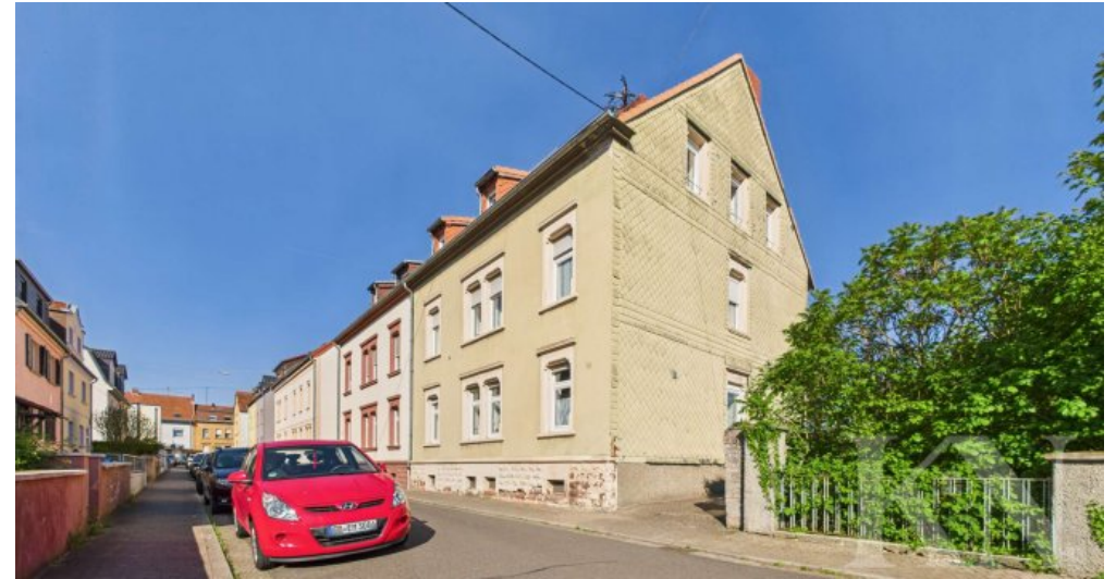
Front Ansicht Haus