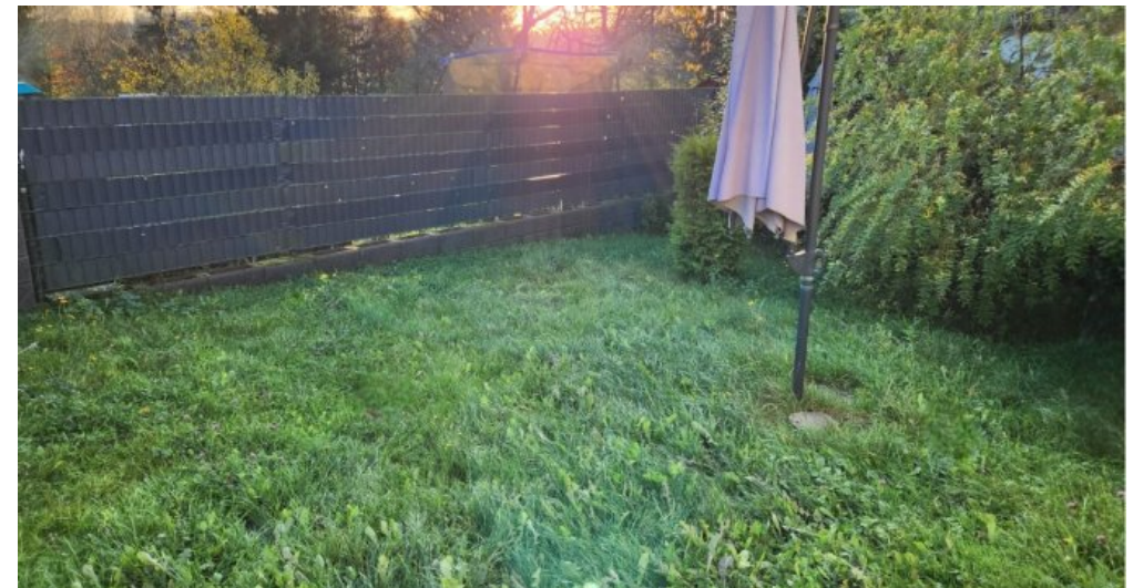
Für die Mieter nutzbarer, umzäunter Garten