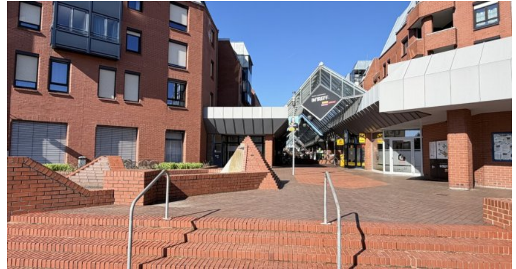
Im Treff - Passage