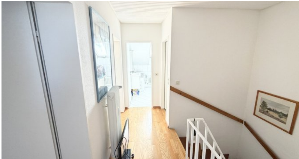
Flur Ebene 2