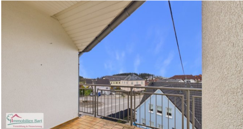
Sonnenbalkon mit Fernsicht