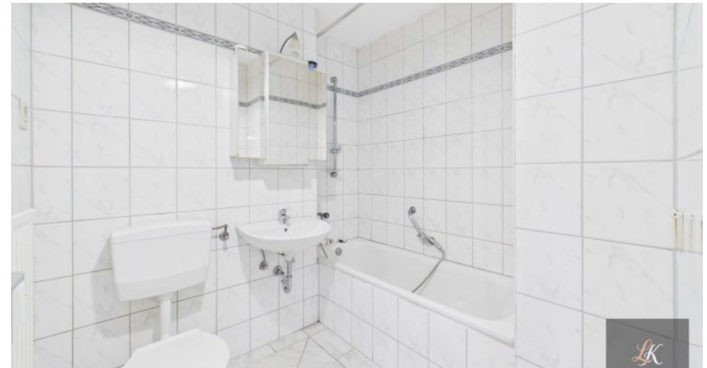
Gepflegte 2-Zimmer-Wohnung mit Balkon in Homburg nahe Uni-Klinik