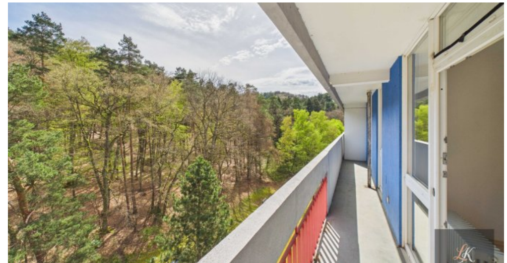
Gepflegte 2-Zimmer-Wohnung mit Balkon in Homburg nahe Uni-Klinik