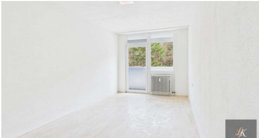
Gepflegte 2-Zimmer-Wohnung mit Balkon in Homburg nahe Uni-Klinik