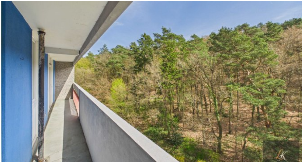
Gepflegte 2-Zimmer-Wohnung mit Balkon in Homburg nahe Uni-Klinik