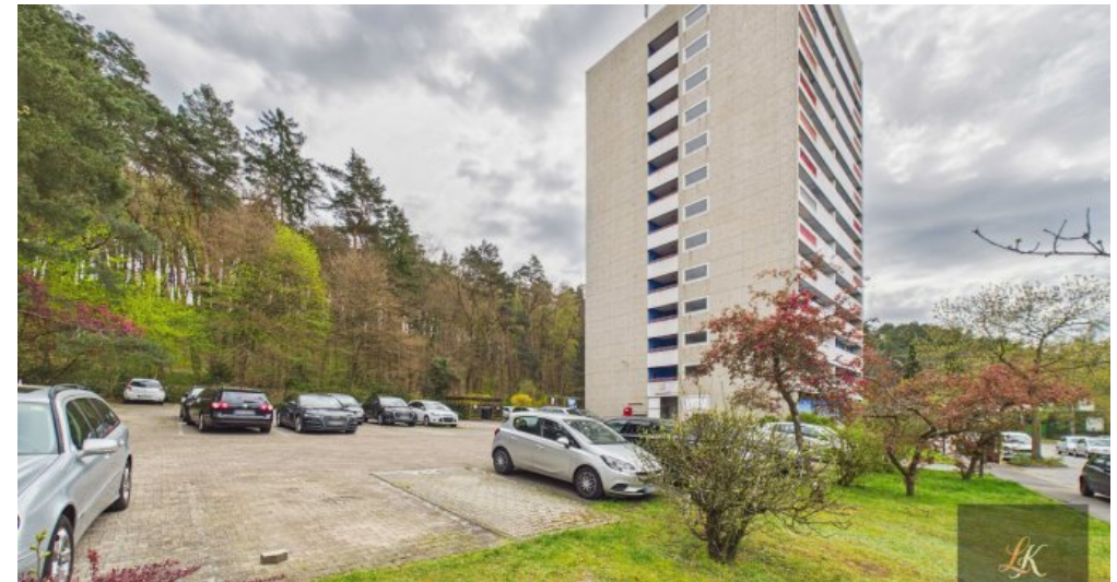
Gepflegte 2-Zimmer-Wohnung mit Balkon in Homburg nahe Uni-Klinik