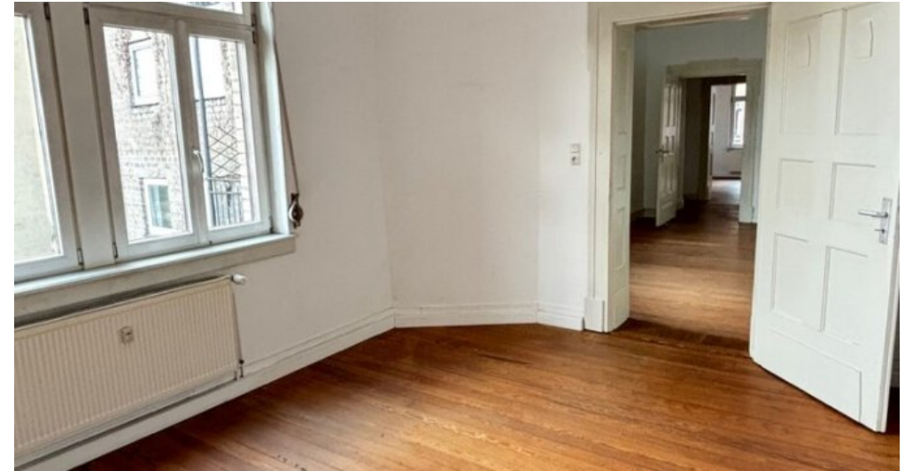
Ansicht Raum 4