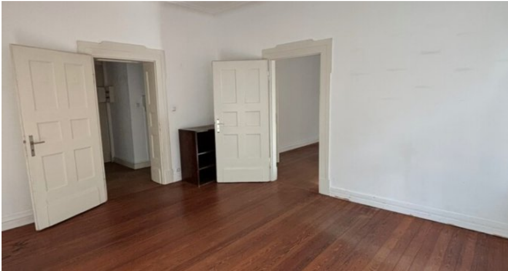
Ansicht Raum 2