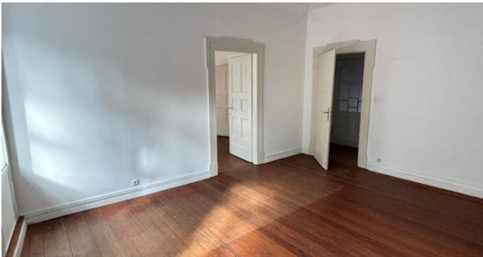
Ansicht Raum 1