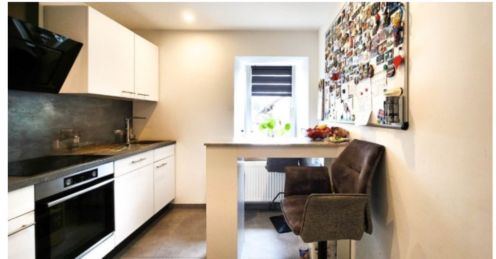
OG rechts Wohnküche mit moderner Einbauküche im Kaufpreis inbegriffen