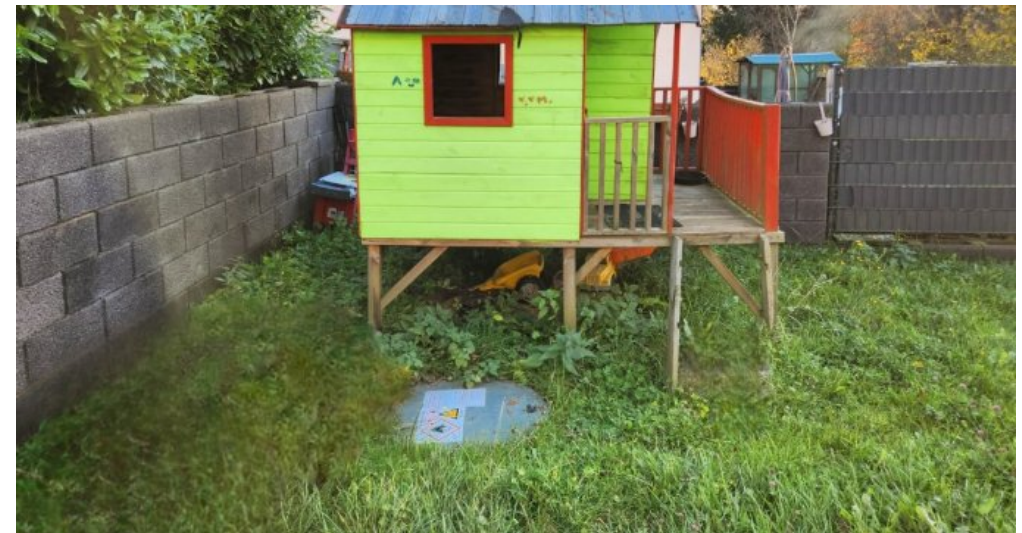
Für die Mieter nutzbarer, umzäunter Garten mit Spielgerät und unterirdischem Flüssiggastank