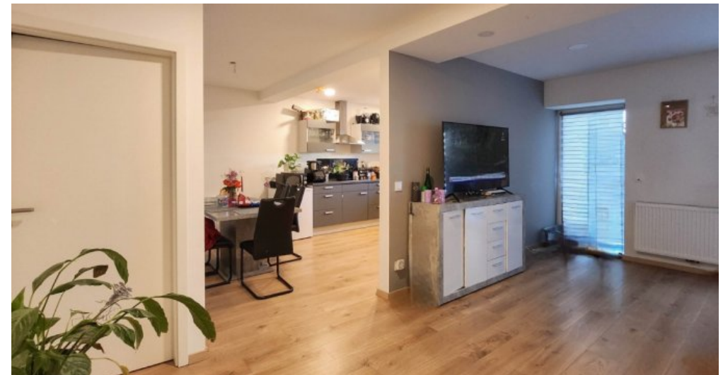
EG rechts offene Raumgestaltung Küche Essbereich Wohnbereich