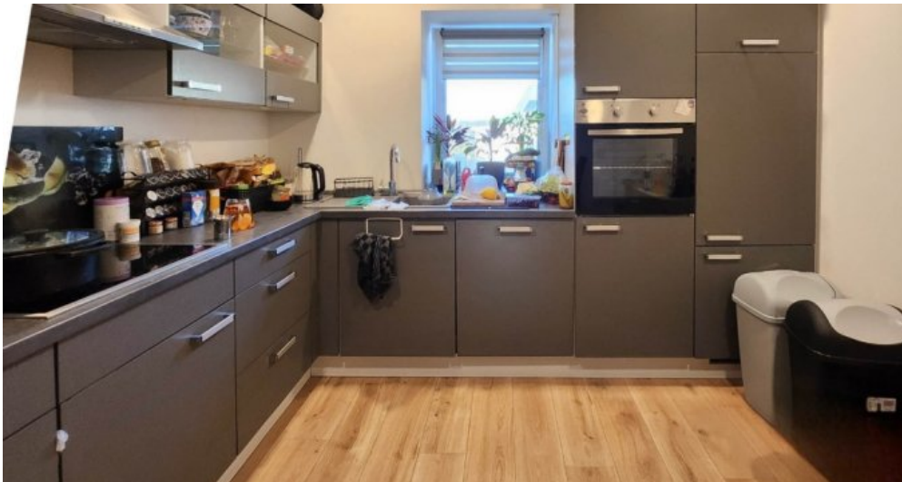
EG rechts moderne Einbauküche im Kaufpreis inbegriffen