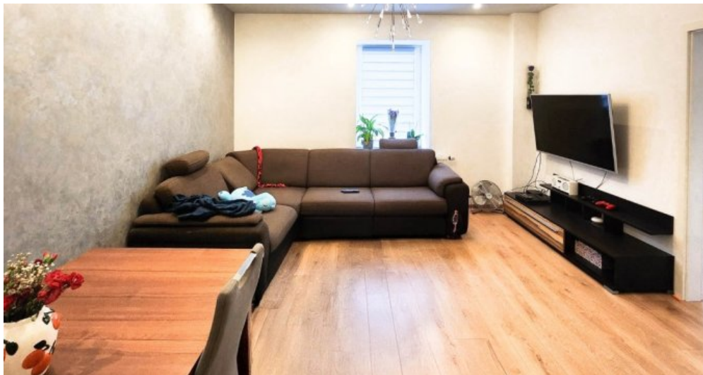
OG rechts großzügiges Wohnzimmer