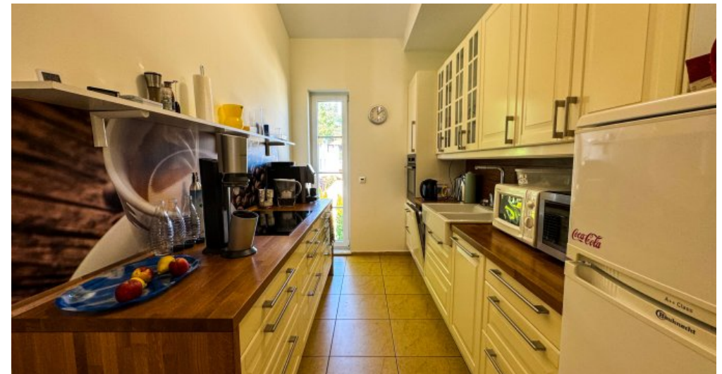
Küche mit Einbauküche OG